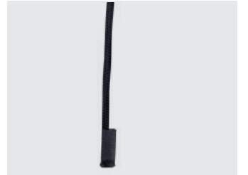
Extrémité cousue sous gaine de protection