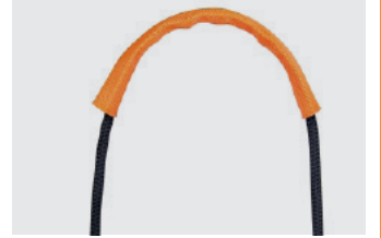
Gaine de protection