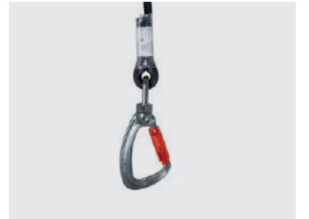
Connecteur acier automatique