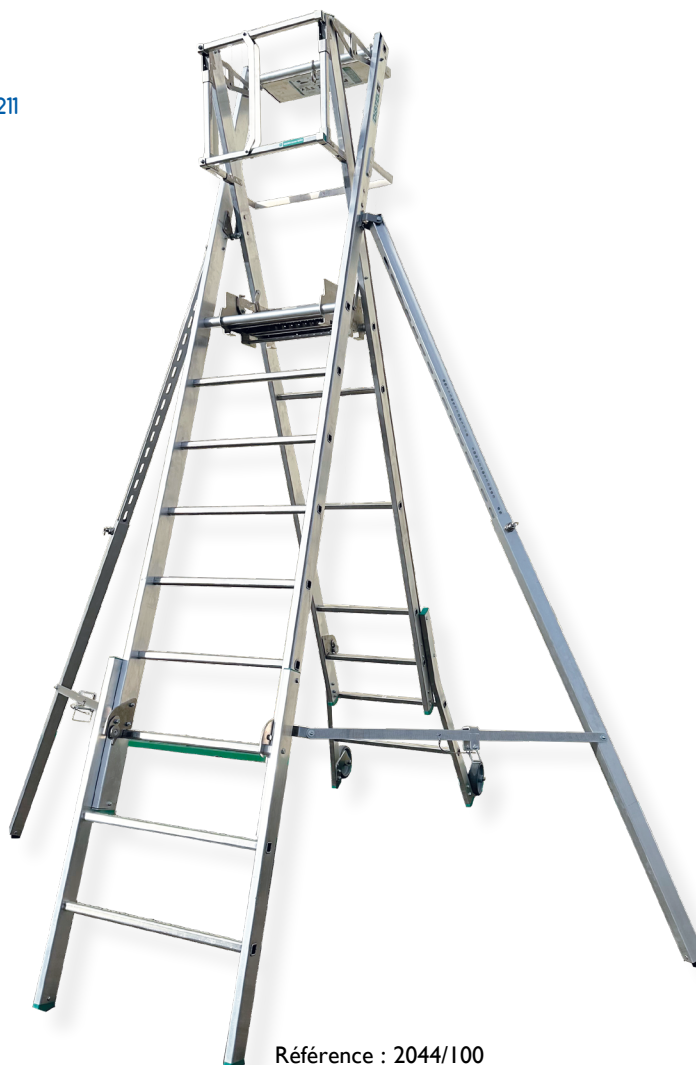
Référence : 2044/100

→ P.I.R. 93-352 + NF E85-211 DÉCRET 2008-244 R. 4323-59