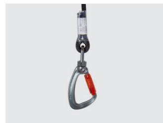
Connecteur acier automatique