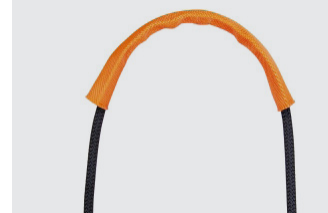
Gaine de protection