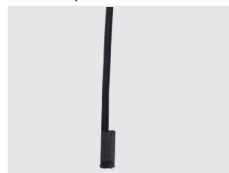
Extrémité cousue sous gaine de protection