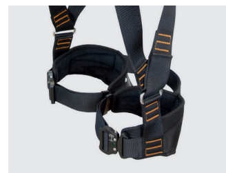
Cuissards moletonnés avec fermeture par boucle automatique