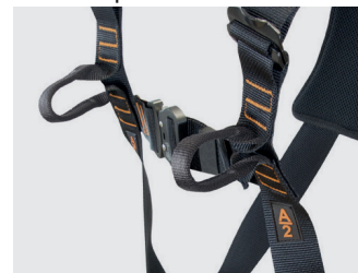
Accrochage sternal antichute sur deux anneaux de sangles