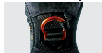
D d'accroche dorsal