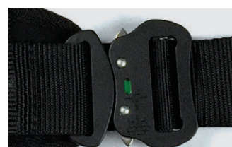
Boucle auto alu avec témoin de fermeture