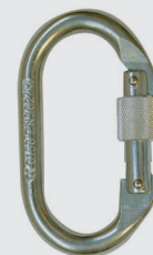
Connecteur acier à vis