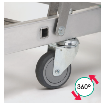
Déplacement multidirectionnel facilité par 4 roulettes pivotantes