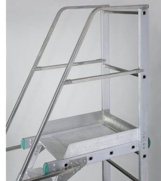
Garde-corps + rampes d'accès