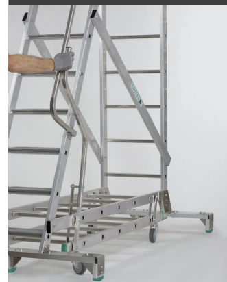
Châssis escamotable à levier