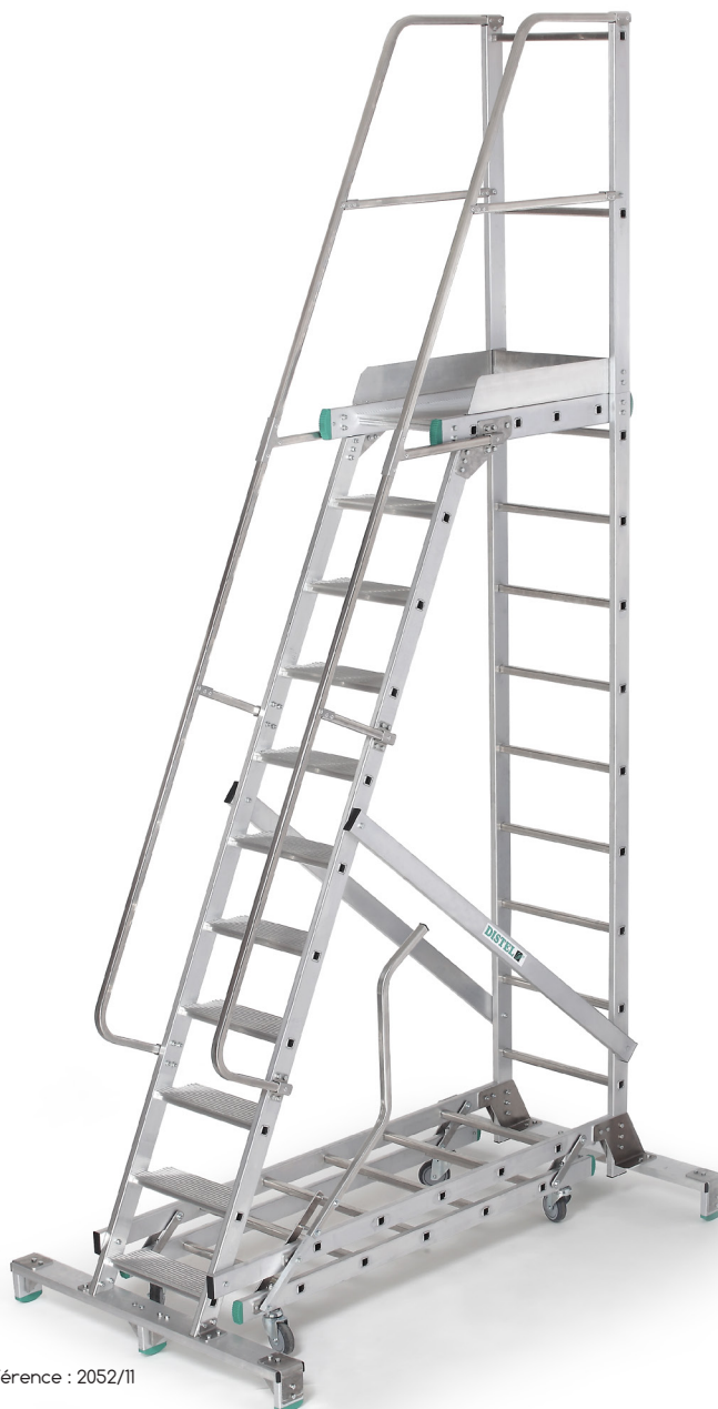
Référence : 2052/11