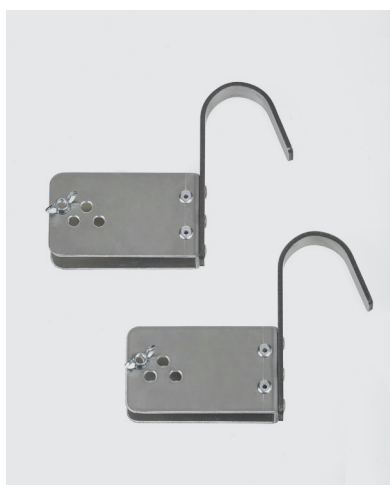
Crochets réglables Ø 50 mm - Réf. 1806/50