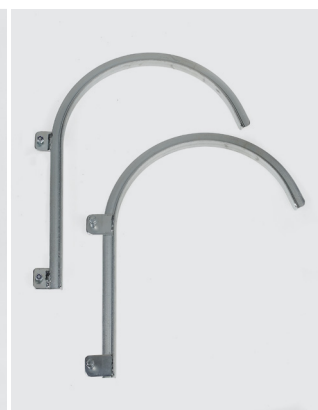
Crochets de fixation (Ø 60 mm Réf. 1805/60 - Ø 120 mm Réf. 1805/120 - Ø 180 mm Réf. 1805/180 - Ø 300 mm Réf. 1805/300)