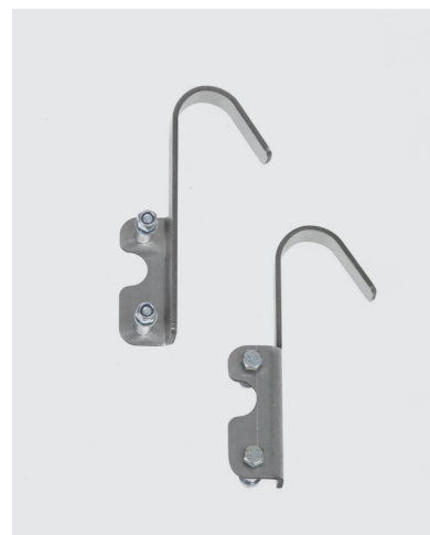
Crochets de fixation Ø 40 mm - Réf. 1805/40