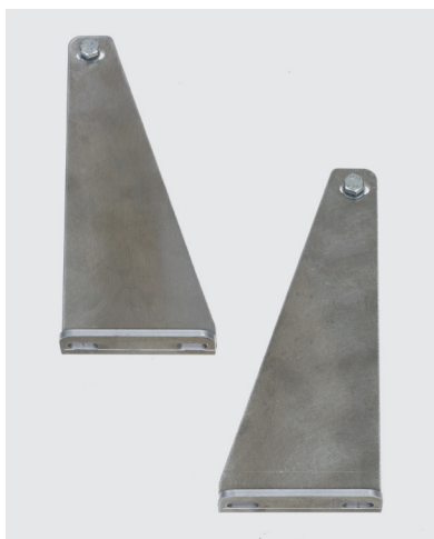
Equerres en alu à spitter Réf. 1808/AL