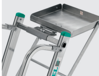
Tablette porte-outils escamotable (réf. 2005/0120)