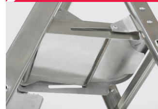
Blocage automatique de la plate-forme