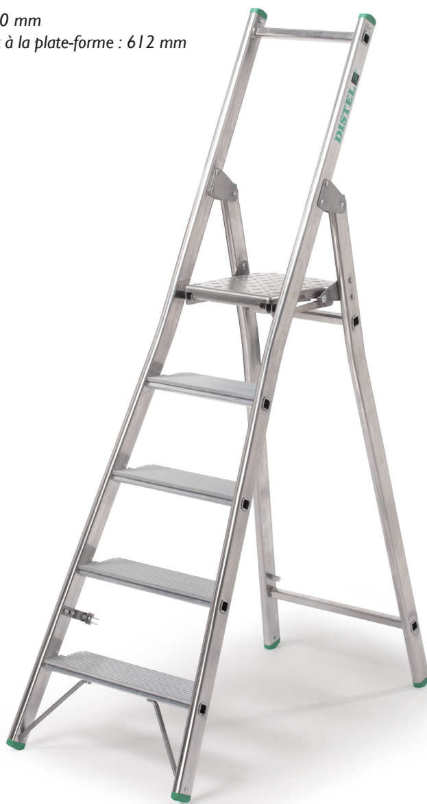
Référence : 2000/05