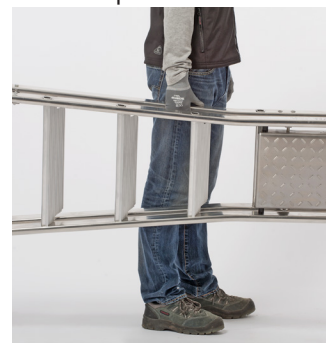
Blocage en position repliée permettant une bonne prise en main