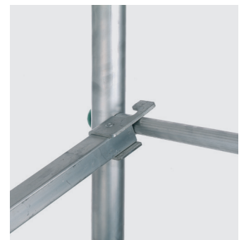
Quart de tour