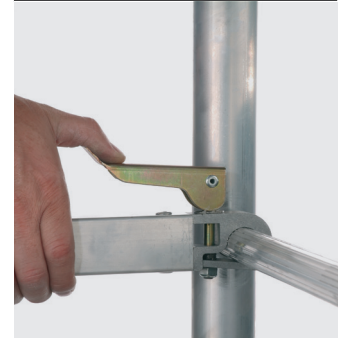
Serrage à CAME