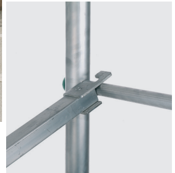
Quart de tour