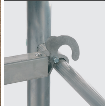
Crochet à bascule