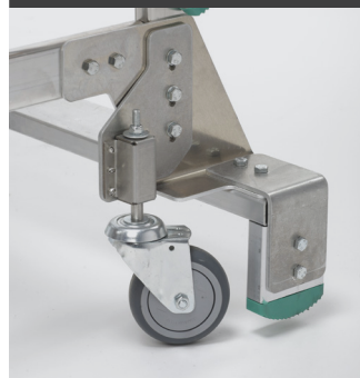
4 roulettes pivotantes escamotables à ressort se bloquant sous le poids de l'utilisateur