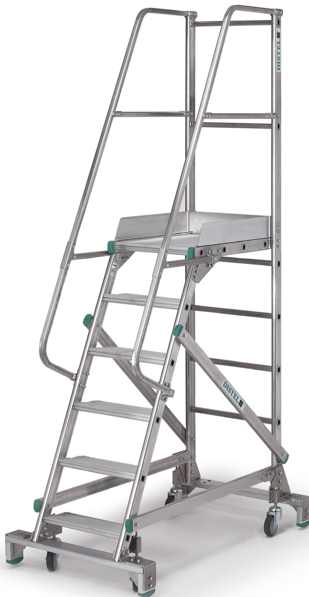
Référence : 2051/06