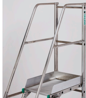
Garde-corps + rampes d'accès