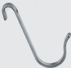
Crochet de service (réf. 17123)