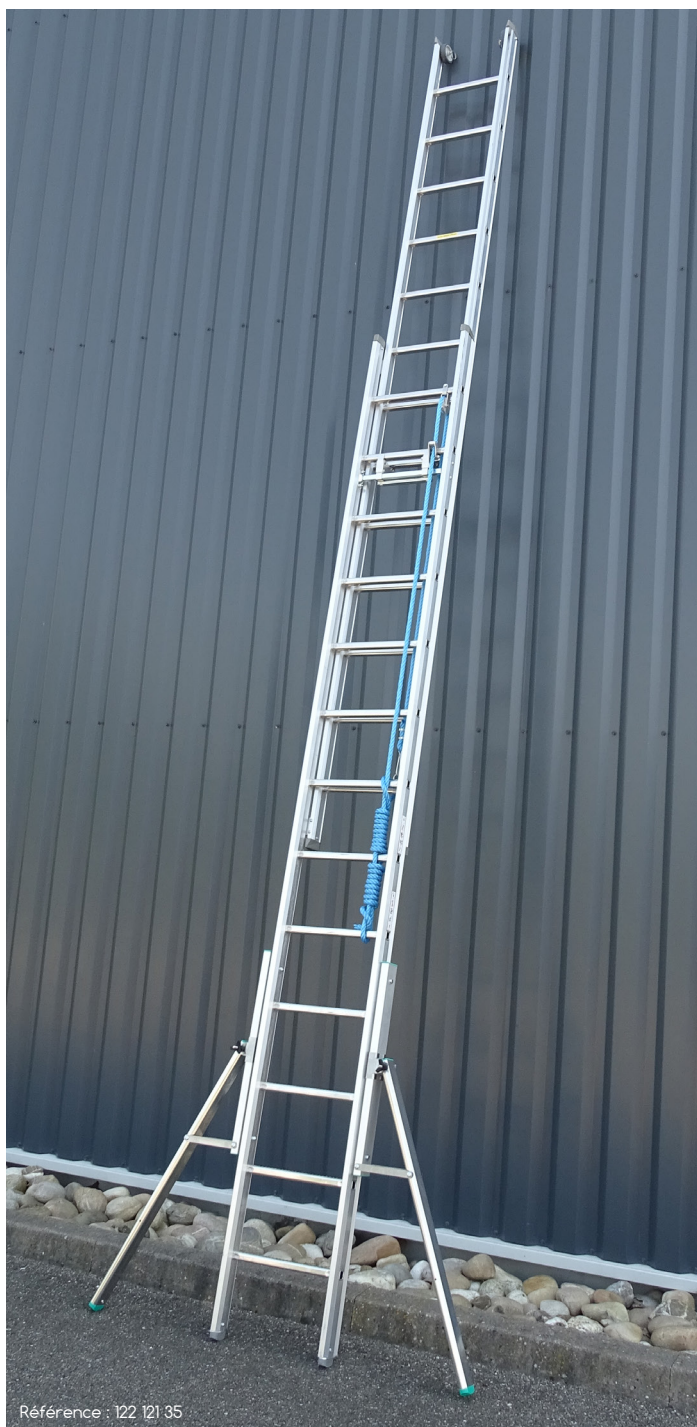
Référence : 122 121 35