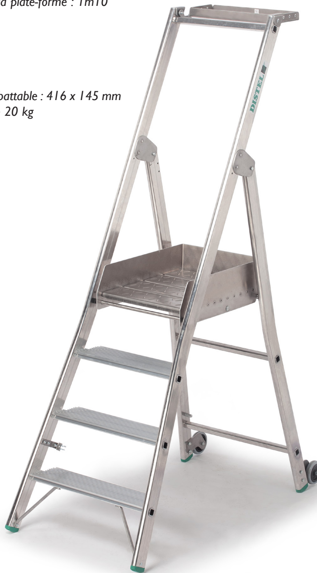
Référence : 2021/04