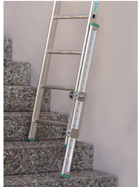
Pied de dénivellation Réf. 1800/67 : pour un profilé de 67 mm Réf. 1800/87 : pour un profilé de 87 mm Permet de rattraper un dénivelé