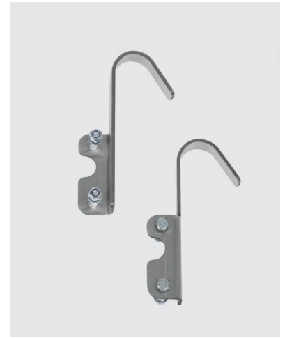
Crochets de fixation Ø 40 mm - Réf. 1805/40