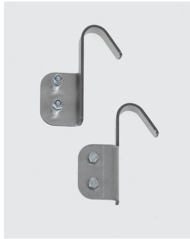
Crochets de fixation Ø 30 mm - Réf. 1805/30