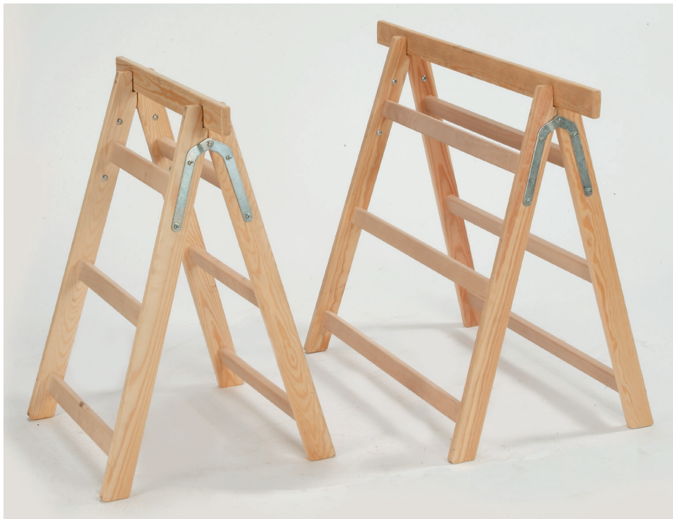
Réf. 411 111 : largeur 0m62 - Réf. 411 121 : largeur 1m00 (barreaux en sapin) Épaisseur repliée 13 cm