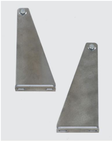
Equerres en alu à spitter Réf. 1808/AL