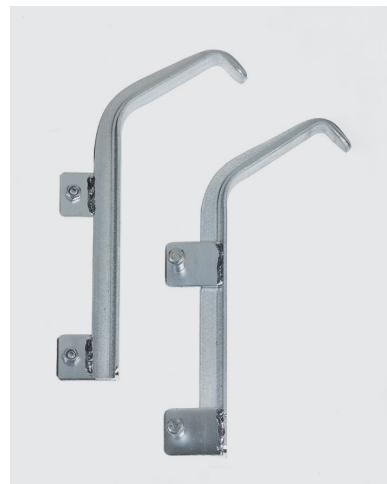
Crochets de fixation plats Ø 100 mm - Réf. 1807/PL