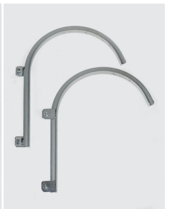
Crochets de fixation (Ø 60 mm Réf. 1805/60 - Ø 120 mm Réf. 1805/120 - Ø 180 mm Réf. 1805/180 - Ø 300 mm Réf. 1805/300)