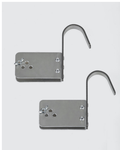
Crochets réglables Ø 50 mm - Réf. 1806/50