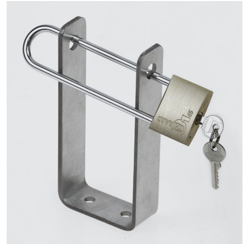
Porte cadenas Réf. 17122 Porte cadenas + cadenas 2 clés