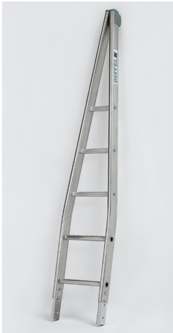
Pointe d'échelle laveur de verre Réf. 1802 Munie aux extrémités de sabots verts anti-traces. Longueur 1m68 S'adapte uniquement sur l'échelle transformable 3 plans de 2m25 Réf. 1031/225 - pour déploiement totale avec la pointe de 6m93